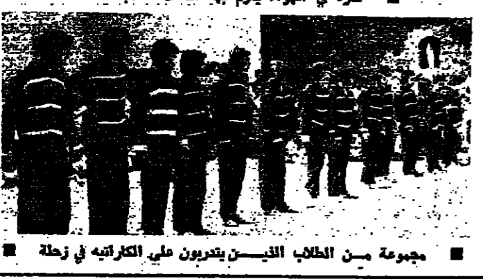
مجموعة من الطلاب الذين يتدربون على الكاراتيه في زحلة